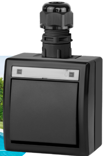
antracytowy RAL 7016