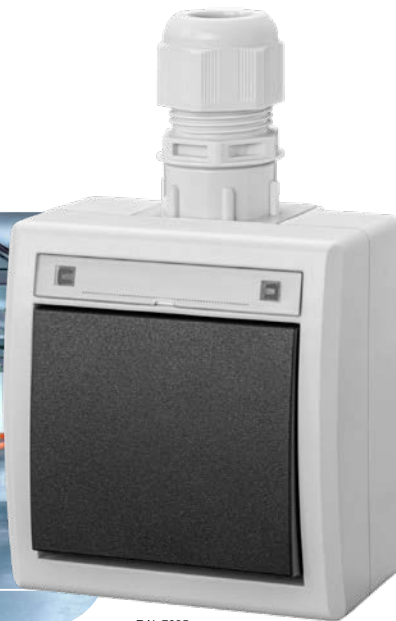
szary RAL 7035