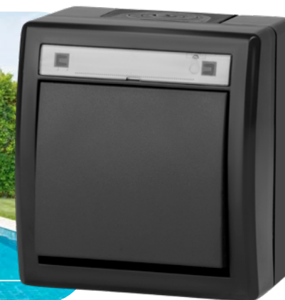
antracytowy RAL 7016