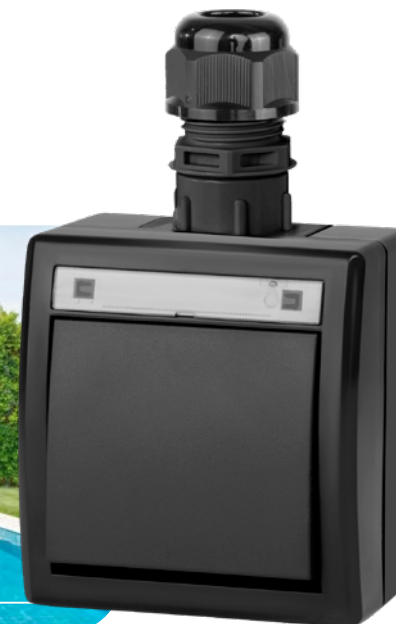
antracytowy RAL 7016