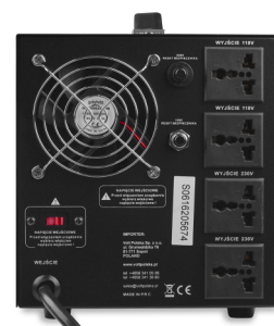
VP 3000 230VAC/110VAC