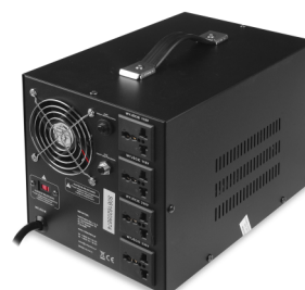
VP 3000 230VAC/110VAC