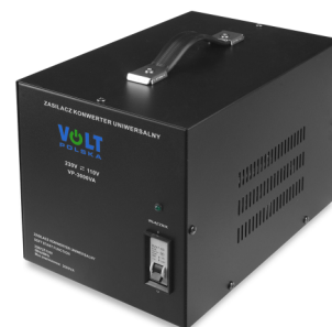
VP 3000 230VAC/110VAC