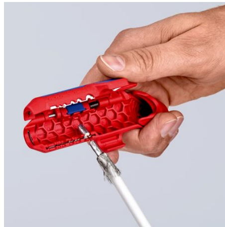
Usuwanie izolacji z kabli koncentrycznych