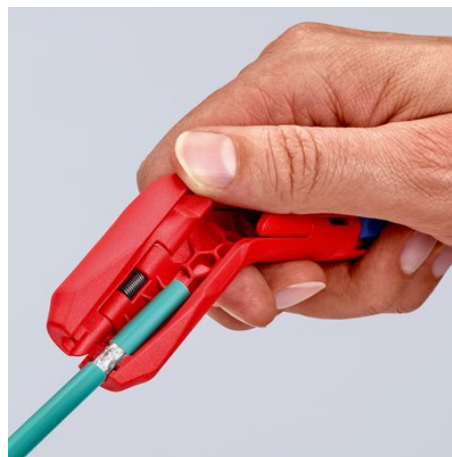
Usuwanie izolacji z przewodu teleinformatycznego