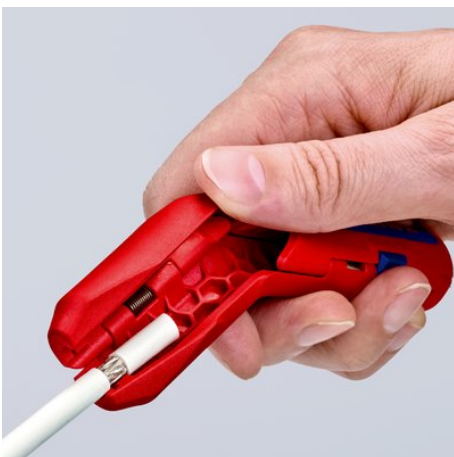
Usuwanie izolacji z kabli koncentrycznych