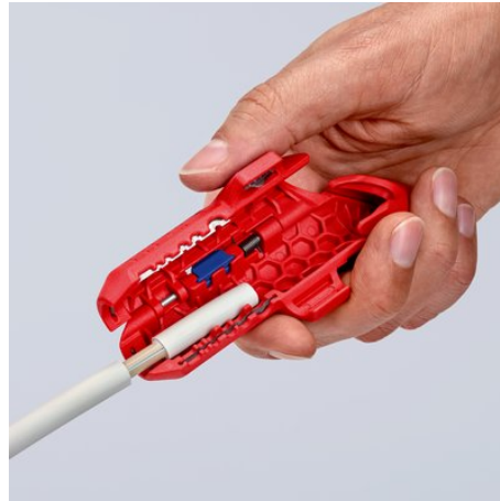
do usuwania izolacji z przewodów NYM