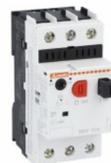
Wyłącznik silnikowy SM1P