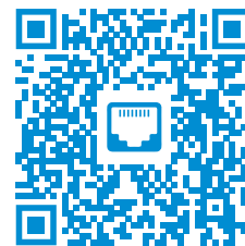
TABELA DOPASOWANIA MODUŁÓW KEYSTONE