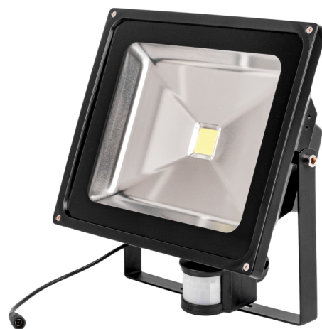
Naświetlacz LED 50W