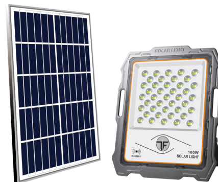
Reflektor solarny LED 100W