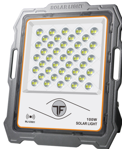
Reflektor solarny LED 100W