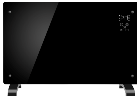
Grzejnik elektryczny TERMOGLASS 2000W