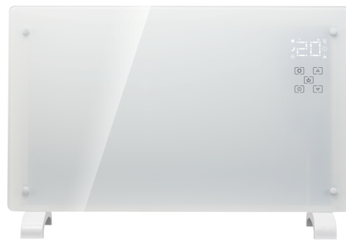
Grzejnik elektryczny TERMOGLASS 2000W