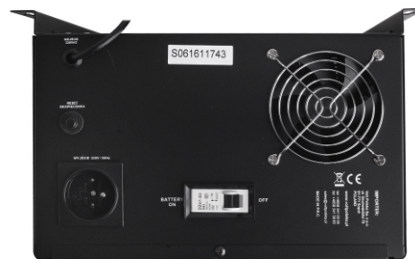
SINUS UPS 500 40Ah