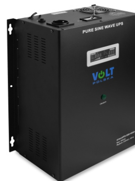
SINUS UPS 500 40Ah