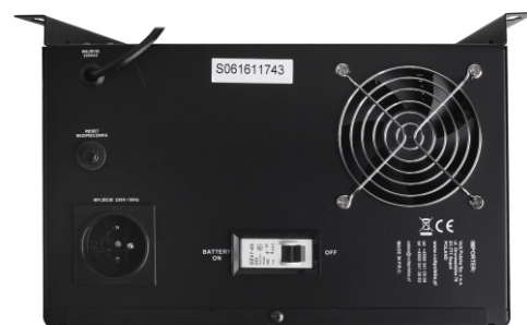
SINUS UPS 800 55Ah