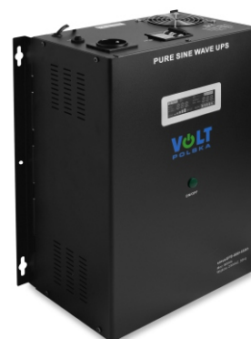
SINUS UPS 800 55Ah