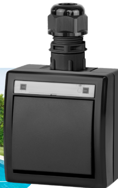
antracytowy RAL 7016