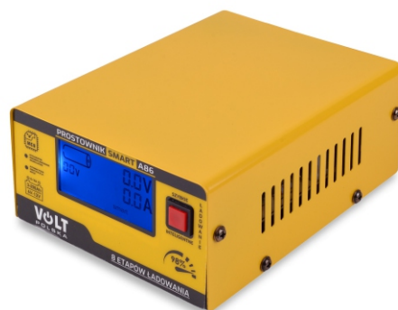
SMART 6V/12V 15A A86