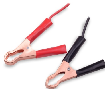
SMART 6V/12V 15A A86