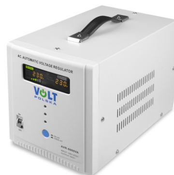
AVR PRO 5000VA