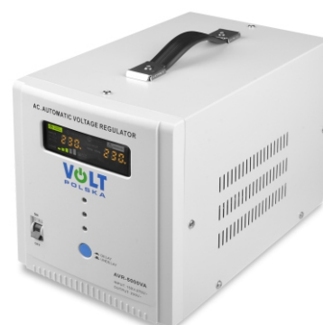
AVR PRO 1000VA