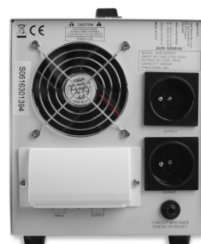
AVR PRO 10000VA