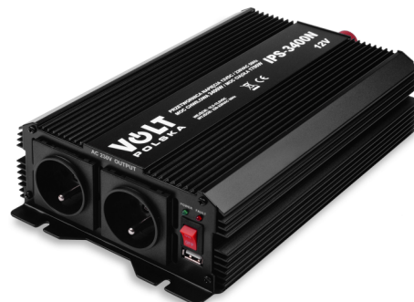
Przetwornica IPS 3400 N 12/24V