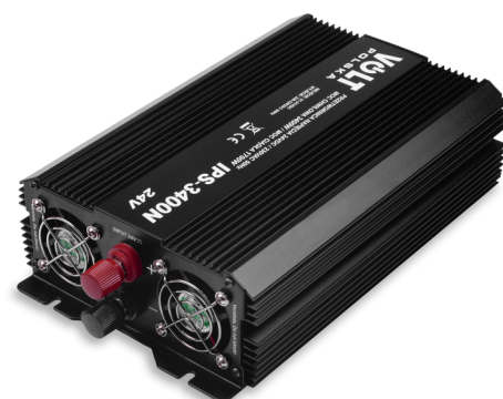
Przetwornica IPS 3400 N 12/24V