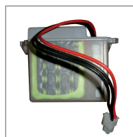
ZASILANIE AWARYJNE Z modułem elektronicznym umożliwiającym ładowanie Tylko dla napędów z silnikami 24 V