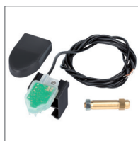
PROcoder (BUS)* Czujnik wykrywania przeszkody