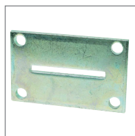
PODSTAWA WSPORNIKA DO SŁUPKA Zestaw 6 płytek mocujących 110x70x5 mm