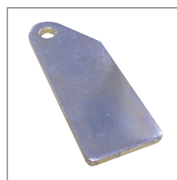
WSPORNIK DO SŁUPKA Zestaw 6 wsporników wys. 160 mm