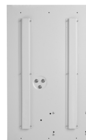
SinusPRO S 7000 48V