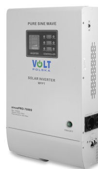
SinusPRO S 7000 48V