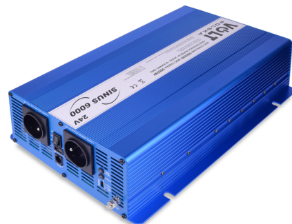
Przetwornica SINUS ECO 6000 12/24V