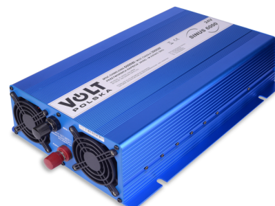
Przetwornica SINUS ECO 6000 12/24V