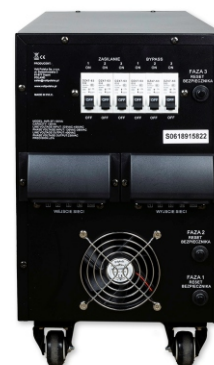
AVR PRO 15000VA 3% 3F