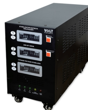
AVR PRO 15000VA 3% 3F