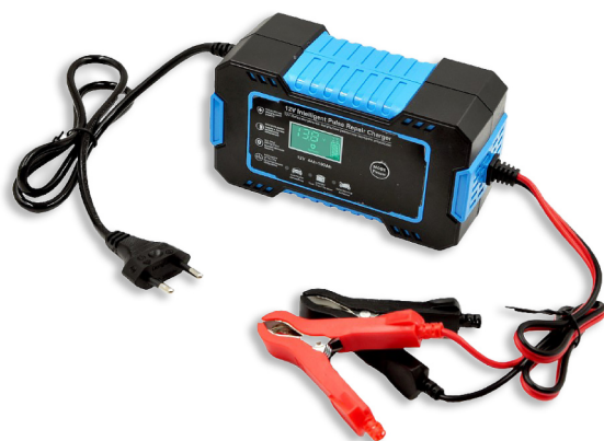
COMPACT 12V 6A LCD