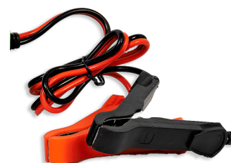
COMPACT 12V 6A LCD