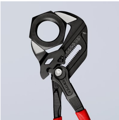
Wymiary metryczne (strona przednia) i calowe (strona tylna) grawerowane laserowo na głowce szczypiec