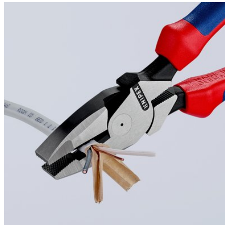
Długie ostrza do cięcia przewodów płaskich