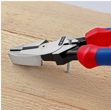
Powierzchnia chwytająca z tyłu złącza umożliwia skuteczne podważanie