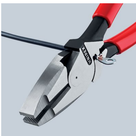
09 11/12 240: z uniwersalnym trzpieniem zagniatającym pod złączem