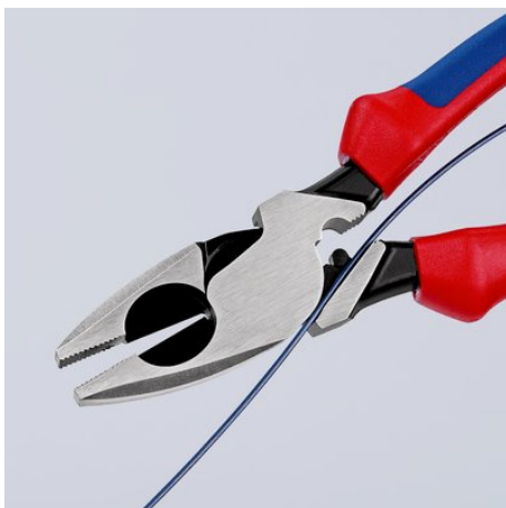
09 11/12 240: ze szczeliną w złączu do przeciągania kabla