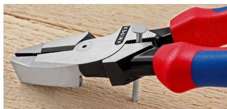
Powierzchnia chwytająca z tyłu złącza umożliwia skuteczne podważanie

Dopuszcza się zmiany i błędy w podanych parametrach technicznych