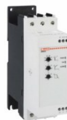
Softstart - wersja podstawowa ADXNB Asynchroniczny trójfazowy