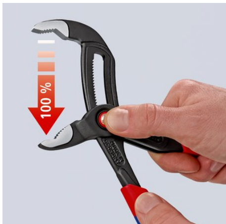
Naciśnąć przycisk - otworzyć całkowicie szczypce