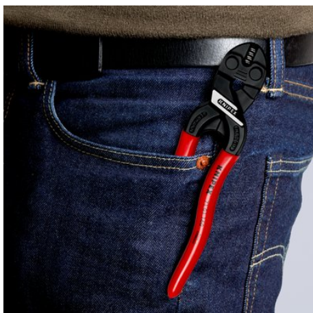
Kompaktowe, lekkie i zawsze pod ręką

Dopuszcza się zmiany i błędy w podanych parametrach technicznych