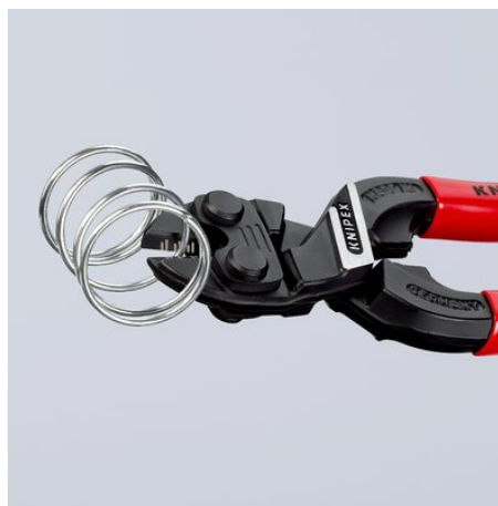
Wydajność aż po wierzchołki