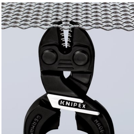
Wąska główka zapewnia bardzo dobrą dostępność