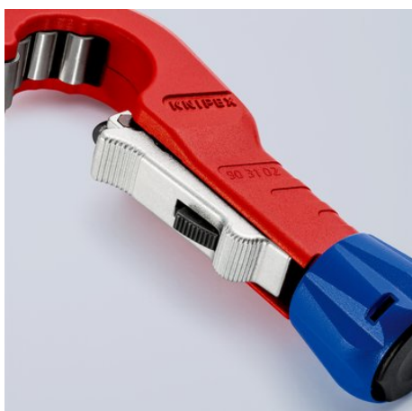
Za pomocą mechanizmu szybkiej regulacji jedną ręką sprężysty krążek tnący może być dosuwany do średnicy rury. Krążek tnący z mechanizmem szybkiej regulacji QuickLock dosuń do rury: szybkie dopasowanie do rur o różnych średnicach ...