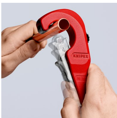
Łatwe cięcie: przyłóż obcinak do rur KNIPEX TubiX® ...