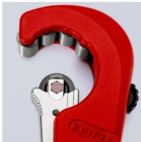
Łatwa wymiana sprężystego krążka tnącego z łożyskiem igielkowym wykonanego z wysokiej jakości stali na łożyska