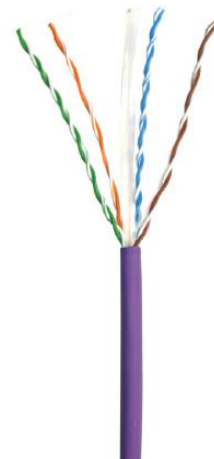
Kabel Kat6 U/UTP

Kabel U/UTP PowerCat 6 jest częścią kompletnej oferty PowerCat 6 spełniającej a nawet przewyższającej wymagania kategorii 6 (ANSI/TIA-568.2-D) oraz klasy E (ISO 11801-1; PN-EN 50173). Kabel posiada specjalny separator krzyżowy rozdzielający poszczególne pary między sobą co pozwala poprawić parametr NEXT i ELFEXT jak również zapewnia dużą odporność na błędy instalacyjne (dzięki dużemu odstępowi parametrów faktycznych od parametrów nominalnych wymaganych przez normę). Produkt jest przeznaczony do instalowania w okablowaniu poziomym oraz pionowym przeznaczonym do przesyłu danych. Powłoka kabla wykonana jest z niepalnego, samogasnącego tworzywa o statusie LSOH (Low Smoke Zero Halogen) – materiał podczas spalania wydziela nieznaczną ilość dymu który dodatkowo nie zawiera tzw. halogenków. Mała średnica zewnętrzna kabla, wysoka elastyczności i doskonałe parametry transmisyjne należą do głównych zalet produktu. Kabel dostarczany jest w 500 m odcinkach nawijanych na drewniane szpule, które ułatwiają prace instalacyjne oraz minimalizują zgięcia/naprężenia w kablu. Szpule mogą być bezpiecznie utylizowane w procesie recyklingu.