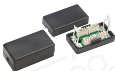
Sekwencja zarabiania modułu połączeniowego WTM08