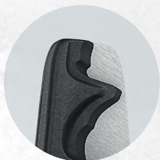
Smukła główka zapewniająca lepszy dostęp