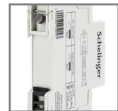
montaż na szynie DIN35