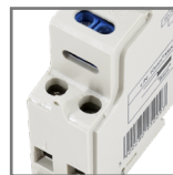
pojemność zacisków max. 2.5mm 2