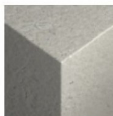
Beton C20/25- C50/60