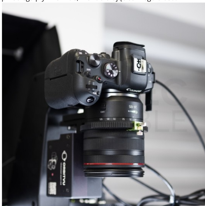
Aparat Canon EOS R6 (2 sz).